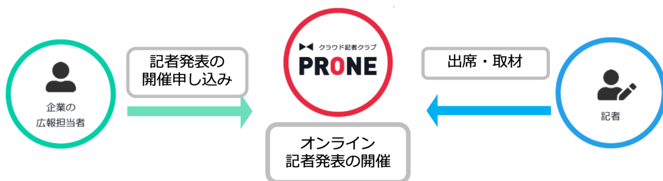
▲オンライン記者発表サービスの提供フロー図

また、その場で記者との質疑応答も可能です。さらに、自社の会議室で記者発表を開催できるため、外部の会場を利用するコストを抑えられるほか、地方企業にとっては、東京に拠点を置く全国メディアや全国各地のメディアとリアルタイムで情報交換ができるメリットもあります。一方で、記者としても、これまで知らなかった企業・団体が開催する発表に気軽に参加ができ、企業情報やサービスに関する情報収集ができるようになります。